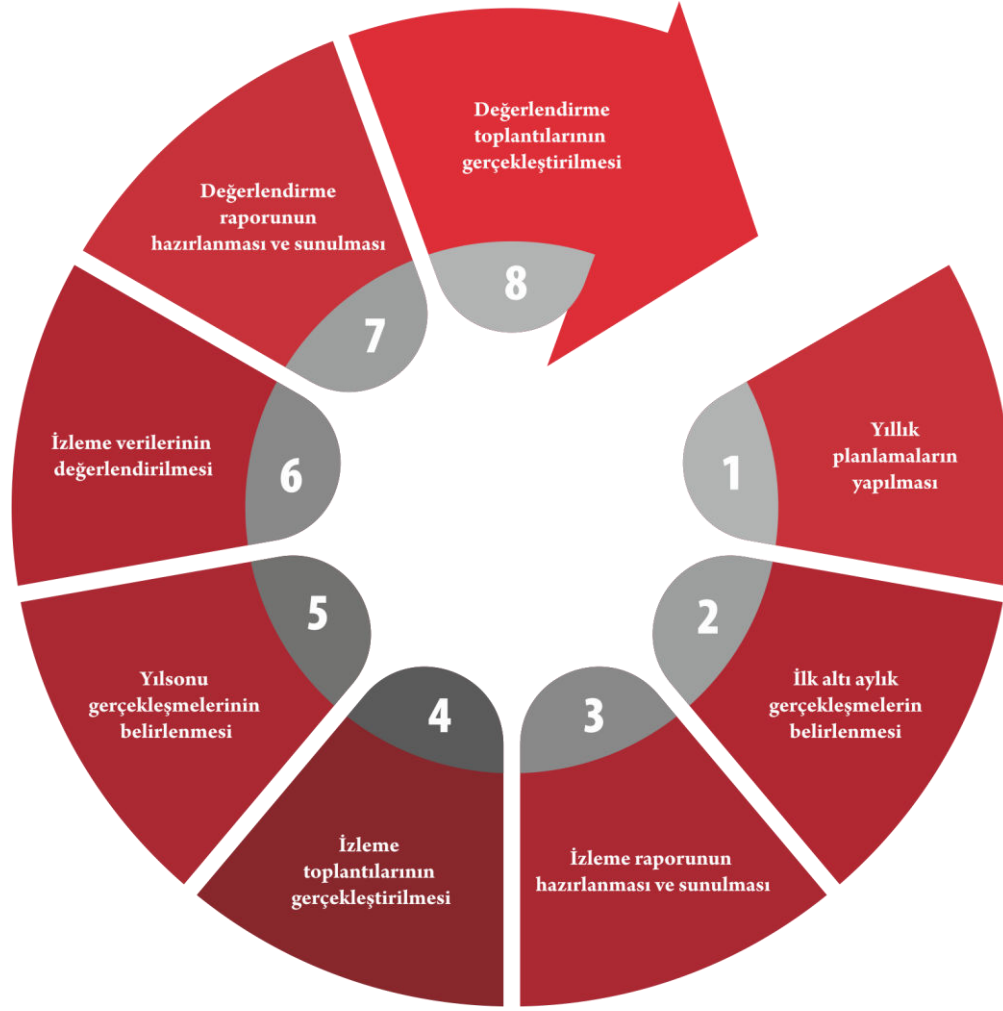
Şekil 2. İzleme Değerlendirme Süreci